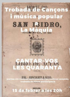
'Cantar-vos les quaranta'