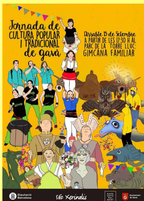
Cartell de la Jornada de Cultura Popular i Tradicional